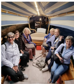
JOB SHADOWING A MALTA, novembre 2025